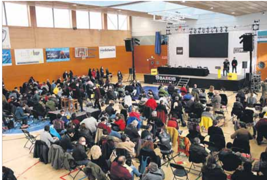
Un moment de l'assemblea que es va fer al pavelló Virrei Amat de Barcelona

Per això va reiterar la seva negativa al pressupost que s'aprovarà la set-