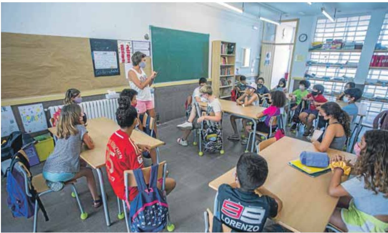
Una mestra de primària, en una classe amb els seus alumnes