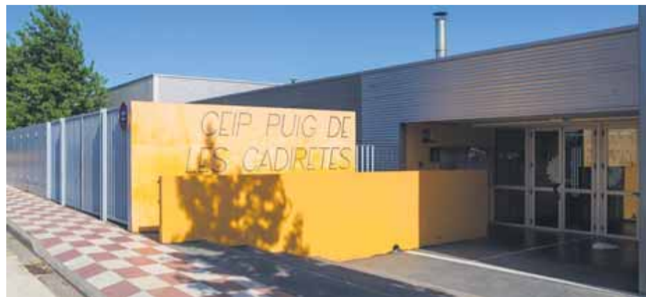
L'escola Puig de les Cadiretes, a Llagostera

■ S'ordena canviar el pla lingüístic en cinc centres públics i dos de concertats ■ Algunes ordres estan impugnades