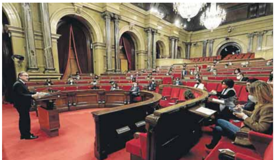
El Parlament va aprovar dijous el pressupost de la Generalitat per al 2022