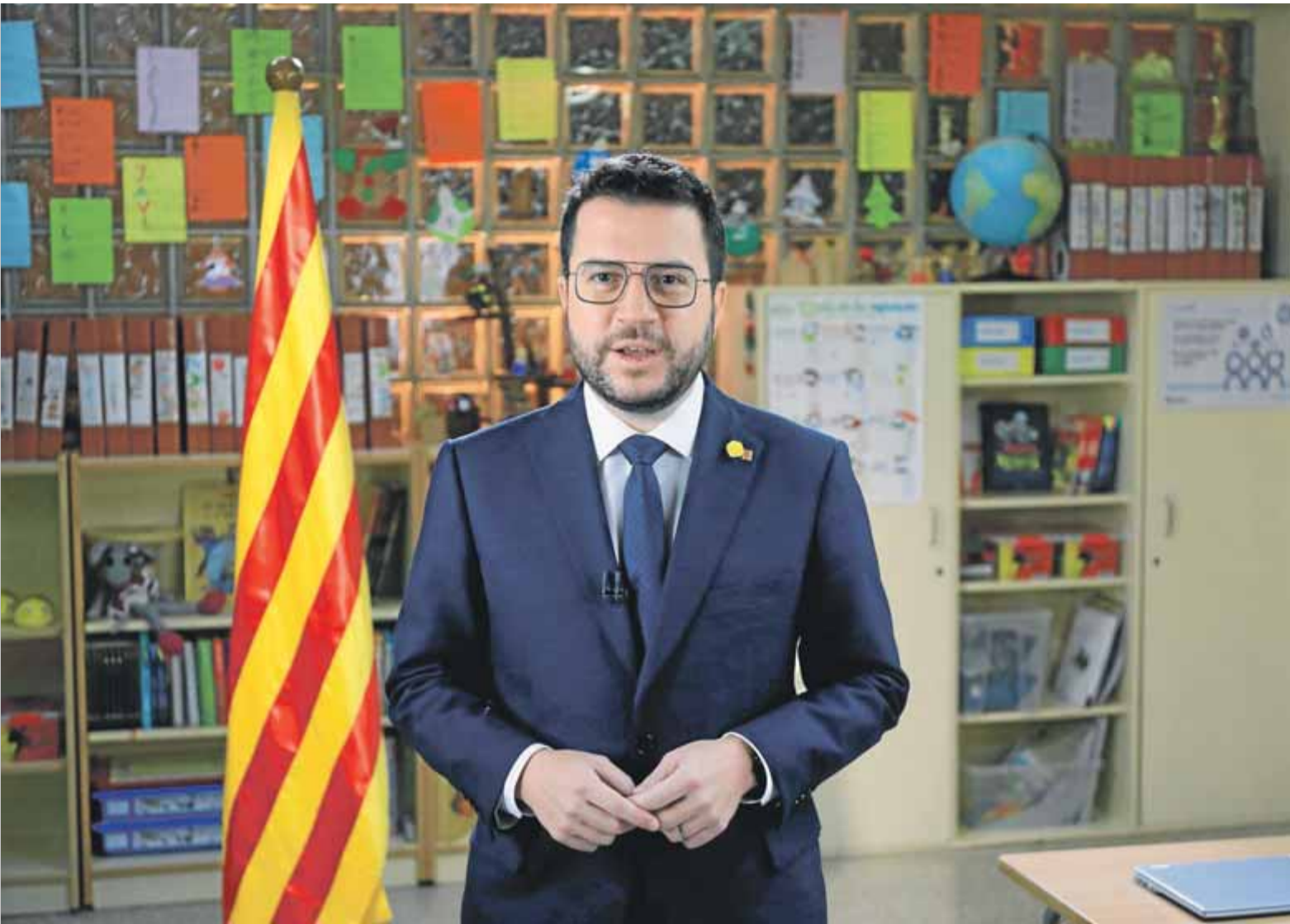
El president de la Generalitat, Pere Aragonès, pronunciant el discurs nadalenç des de l'escola Rosselló-Pòrcel de Santa Coloma de Gramenet