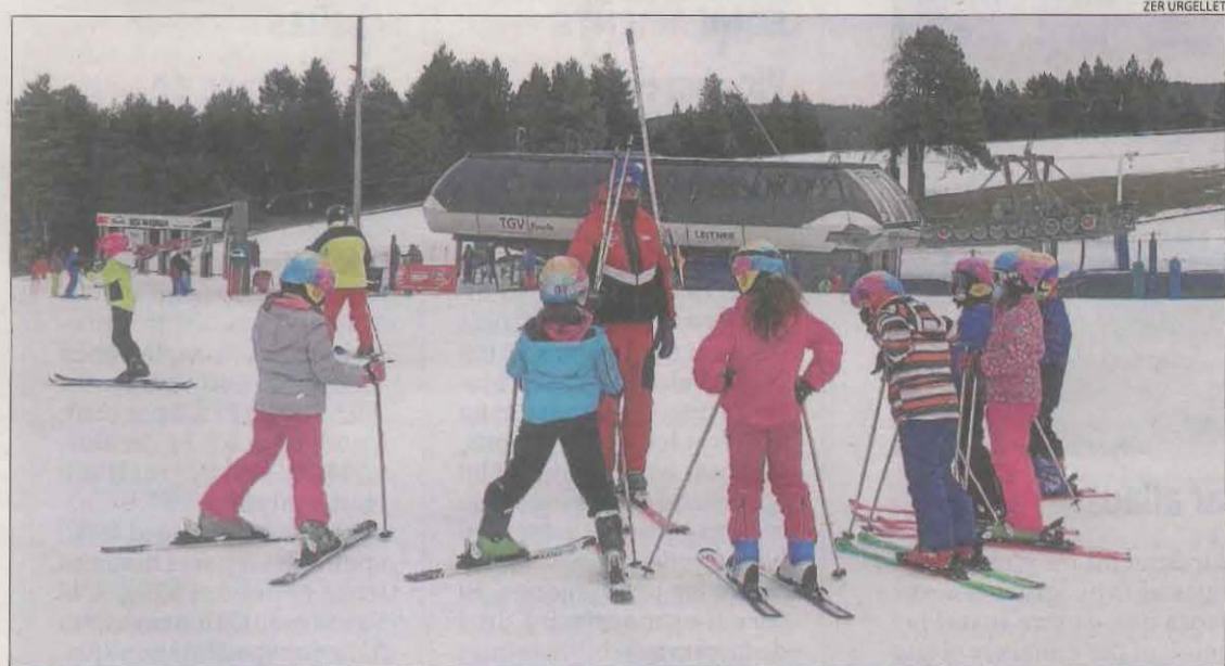
Alumnes de la ZER Urgellet van estrenar ahir el programa d'Esport Blanc a l'estació de Masella.

■ Després de recollir cabals dels barrancs de Baish Aran es va desbordar aigües avall a França.