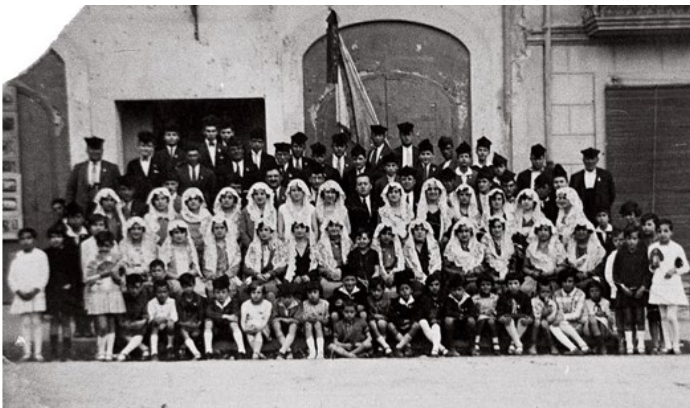
TOT EL POBLE IMPLICAT. Imatge del 1926. Totes les famílies de Tremp han estat involucrades amb l'Orfeó des del seu naixement.