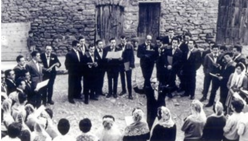
LES CARMELLES. Concert de Caramelles l'any 1961. Les Caramelles formen part del repertori fix d'aquesta coral.

L'Orfeó de Tremp sempre aixoplugat per les entitats d'aquesta localitat pallaresa, a més de l'expo-