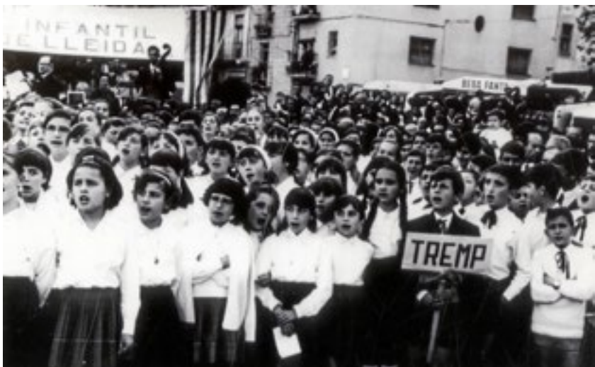
APLEC INFANTIL. La Coral infantil de l'Orfeó de Tremp en l'aplec de corals de l'any 1967.