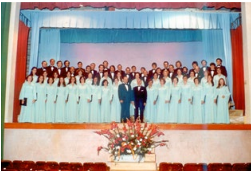
CONCERT DEL PRIMER CENTENARI. Concert per celebrar el primer centenari el mes de maig del 1977.