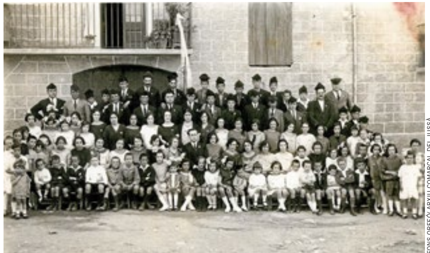
GRANS I PETITS. Tots els cantaires de l'Orfeó en una imatge del 1926.

L'any 1908 La Lira es va reconvertir en la Societat Coral i de Socors Mutus La Lira de Tremp , amb nous estatuts i reglament. Segons la