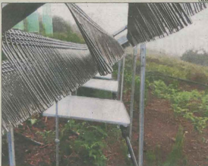
Equips per captar aigua de boira a les illes Canàries.